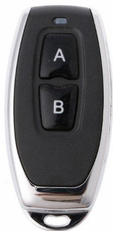
Рисунок 6.3.1 Пульт д/у