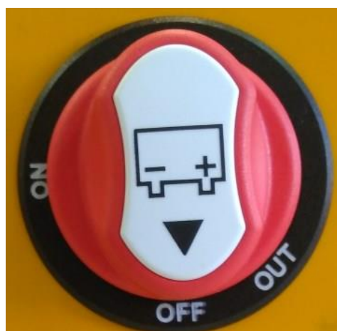
Рисунок 6.3.2 Тумблер ВКЛ/ВЫКЛ

Прикрепите вакуумный захват напрямую или косвенно к крюку или другому крепежному устройству крана, подъемного устройства или ручного манипулятора.