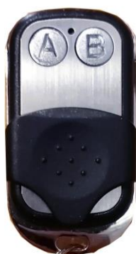
Рисунок 6.3.1 Пульт д/у